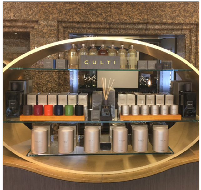
HARRODS - LONDRA