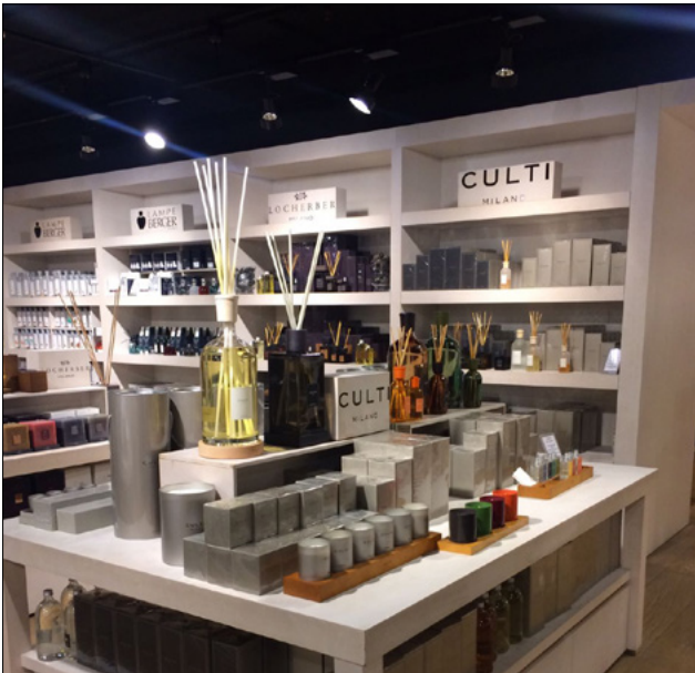
LA RINASCENTE - MILANO