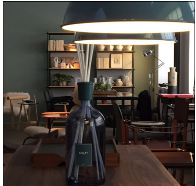
AGAPE - MILANO