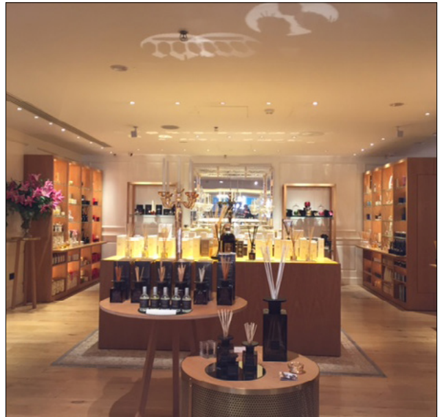
FORTNUM&MASON - LONDRA