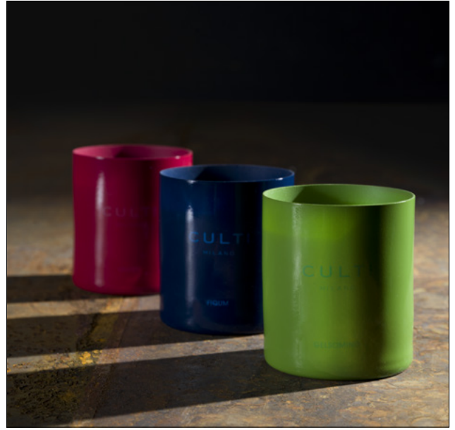
CANDELE - COLOURS