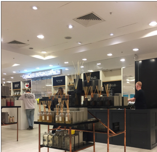
SELFRIDGES - LONDRA