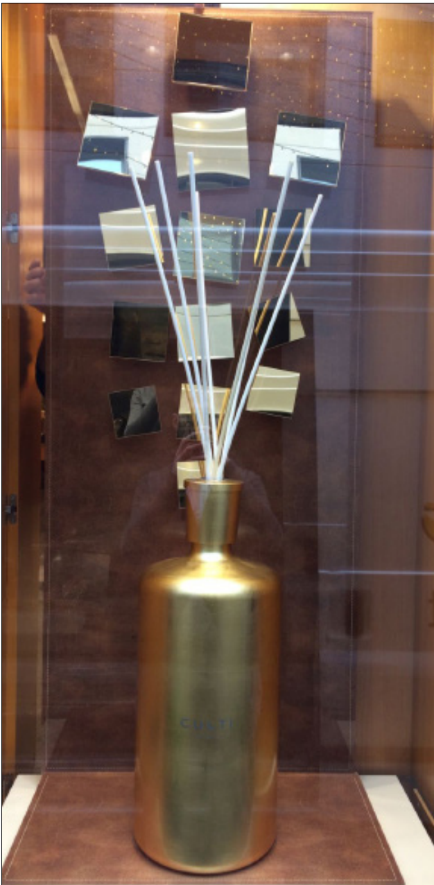
BOUTIQUE FIORI CHIARI - MILANO