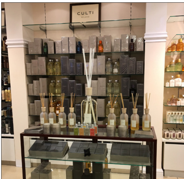
APROPOS - DUSSELDORF