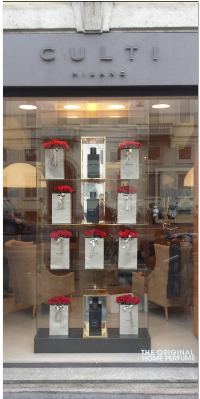
BOUTIQUE CORSO VENEZIA - MILANO