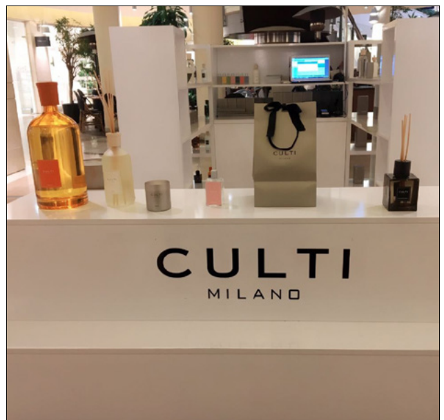
ABC - BEIRUT