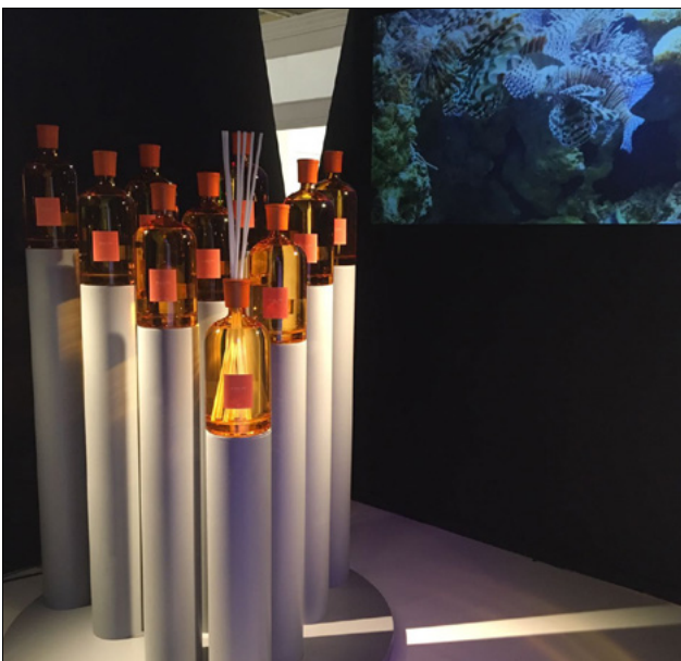
FIERA HOMI - MILANO